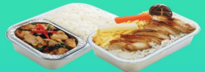
บริการอาหารร้อนบนเครื่อง ขาไป - ขากลับ