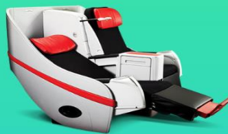
พรีเมียมแฟลตเบด