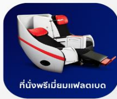
ที่นั่งพรีเมียมเฟลคซ